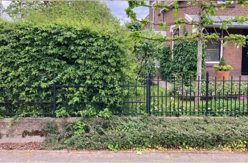
Aan de Rijksstraatweg vormt een ontworpen erfscheiding de grens tussen openbaar gebied en het erf.