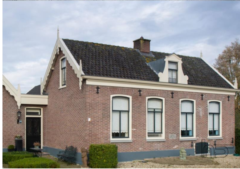
De representatieve gevels zijn gericht op de Rijkstraatweg en rijker geornamenteerd dan de langsegevels.