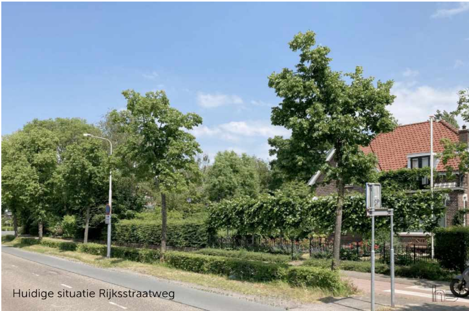
Huidige situatie Rijkstraatweg